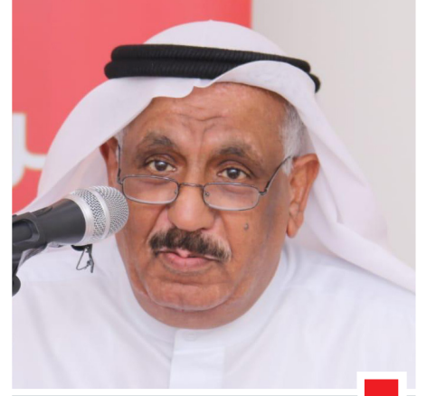
بقلم: م. عبدالله الحويحي

وقد تم تشكيل عدد من لجان التحقيق في مجلس النواب السابق ورفعت هذه اللجان توصيات، كذلك قامت مؤسسات المجتمع المدني بالعديد من