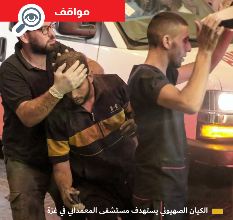
الكيان الصهيوني يستهدف مستشفى المعمداني في غزة

ودعا كافة أبناء شعب البحرين إلى استمرار التعبير عن وقوفهم إلى جانب شعب فلسطين وقضيته العادلة والمبادرة إلى تقديم كافة أشكال الدعم والمساندة.